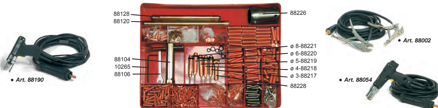
● Kit perni, Boccole, Faston - Kit of studs, Bushes, Faston - Kit pernos, Pernos de rosca interior, Faston

● Standard / Standard / Standard ○ Su richiesta / On request / Bajo demanda